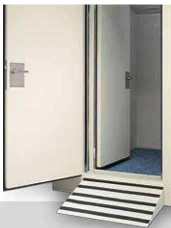
DW interno con porta doppia